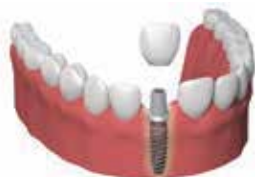
SOSTITUZIONE DI UN DENTE SINGOLO