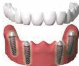
SOSTITUZIONE DI UN'ARCATA DENTALE COMPLETA