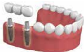
SOSTITUZIONE DI UNO O PIÙ DENTI